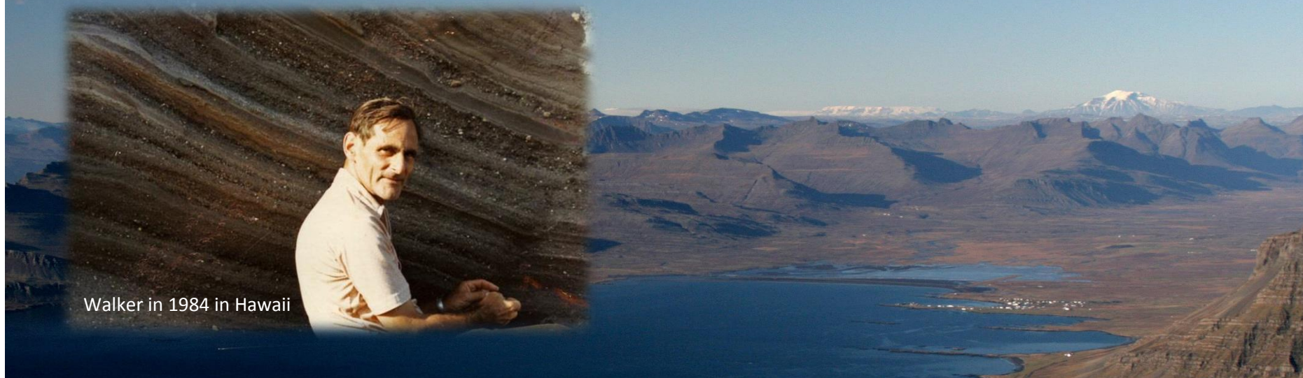
Walker in 1984 in Hawaii

Breiðdalssetur will be holding a symposium about the geology of East Iceland, to uphold and honour the memory of the British geologist George P.L. Walker and to arouse interest of the geology of East Iceland. The symposium holds the title „In the footsteps of George P.L. Walker“ and will take place the weekend 30th-31st august 2014 . Lectures will be held on the Saturday and on the Sunday is planned for a scenic tour in Berufjörður fjord and Breiðdalur valley. The goal of this symposium is to introduce the geology of East Iceland (especially the Tertier lava pile) to the general public and researchers and tell people more about practical applications of the geology of East Iceland (for example geothermal heat and tunnel building). Walker founded a practical methodology in mapping the Tertier lava pile of East Iceland and it is often said that Walker taught the Icelanders how to map the geology of their own country. There is more truth in that statement than many believe, because the information he gathered in the nineteenfifties and sixties is still being used today almost without any modifications, for example with the construction of Norðfjarðagöng tunnel.